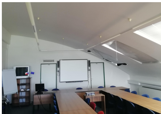
POHLED NA ZASEDACÍ MÍSTNOST