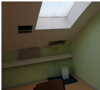
POHLED NA STŘEŠNÍ OKNO